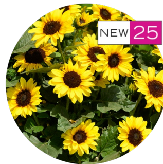
SOL SEEKER™ Honey

Для получения дополнительной технической информации о выращивании: