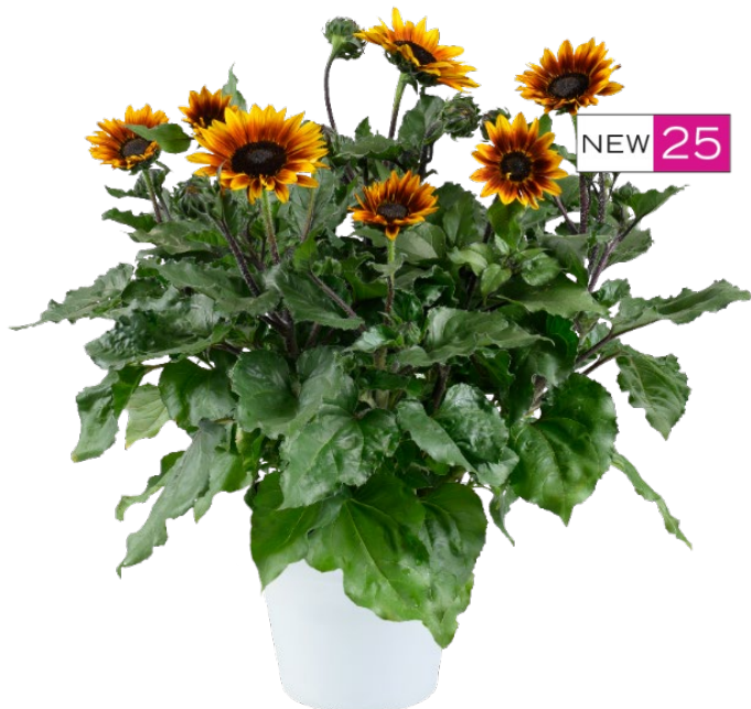
SOL SEEKER™ Bronze Burst