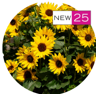
SOL SEEKER™ Bee Yellow