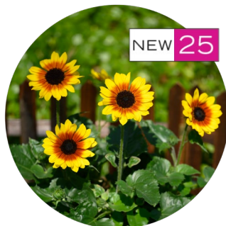
SOL SEEKER™ Golden Nectar