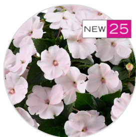
SOL LUNA PRIME™ Pearl

D'autres variétés de la série SOL LUNA PRIME™ :