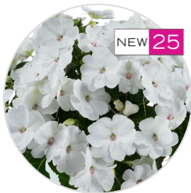
SOL LUNA PRIME™ White

Pour des informations supplémentaires sur la culture technique: