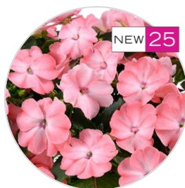
SOL LUNA PRIME™ Light Salmon