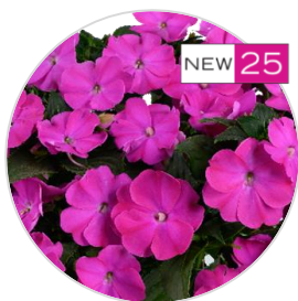
SOL LUNA PRIME™ Orchid