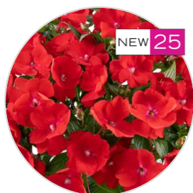
SOL LUNA PRIME™ Red