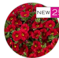
LIA™ Chili Pepper