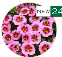
LIA™ Spark Pink