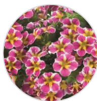
LIA™ Abstract Pink