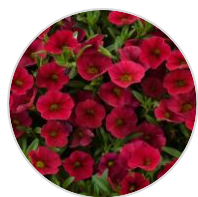
LIA™ Dark Red