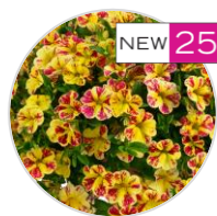
LIA™ Abstract Lemon Cherry