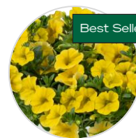
LIA™ Yellow Imp.