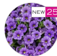
LIA™ Sky Blue