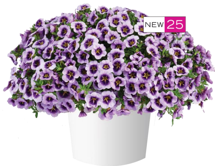
LIA™ Spark Lavender