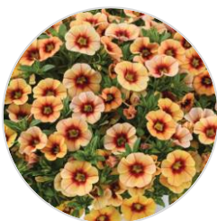
EYECONIC™ Compact Sunset