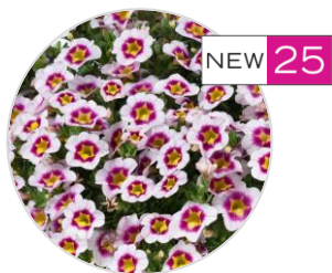
EYECONIC™ Cherry Blossom Imp.