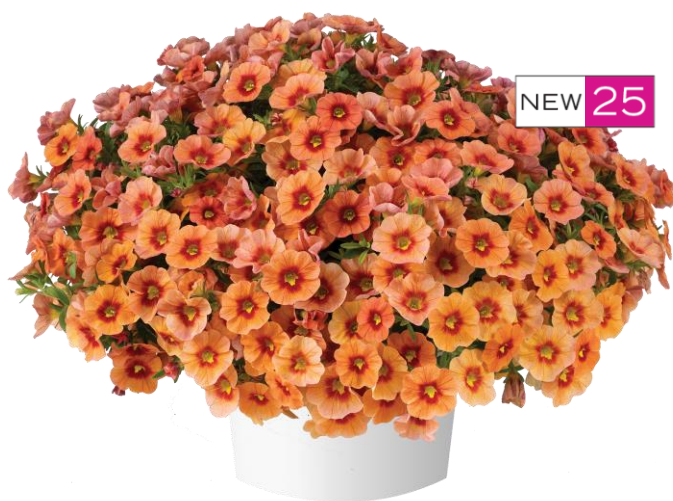
Сорт EYECONIC™ Orange