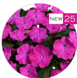
SOL LUNA PRIME™ Orchid