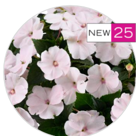
SOL LUNA PRIME™ Pearl