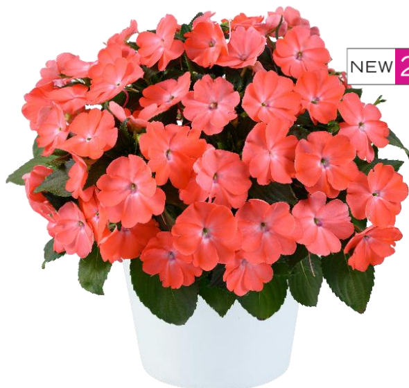
SOL LUNA PRIME™ Peach