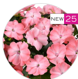
SOL LUNA PRIME™ Light Salmon