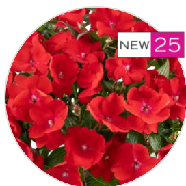
SOL LUNA PRIME™ Red