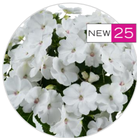
SOL LUNA PRIME™ White

Для получения дополнительной технической информации о выращивании: