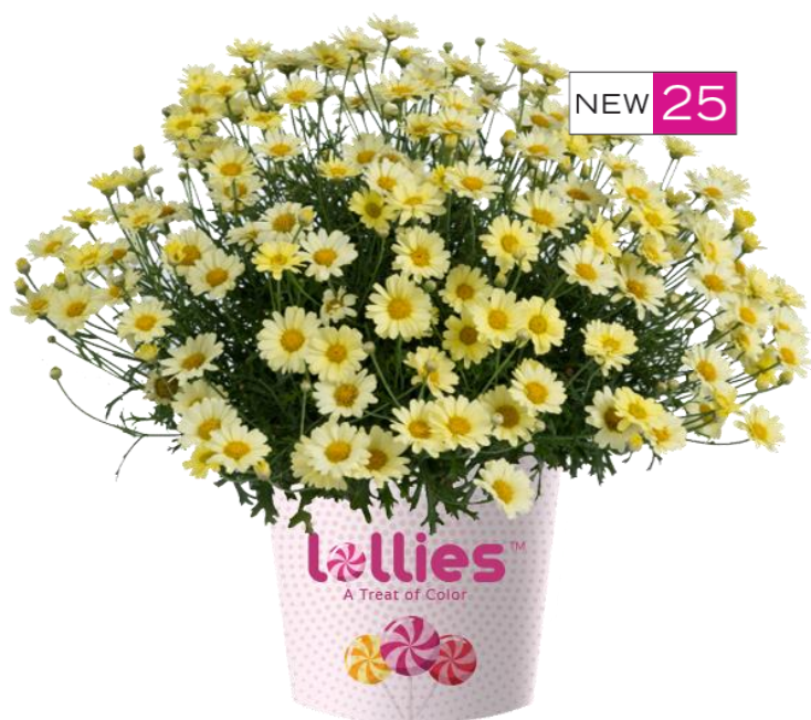
LOLLIES™ Buttermint Imp.