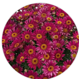
LOLLIES™ Berry Gummy