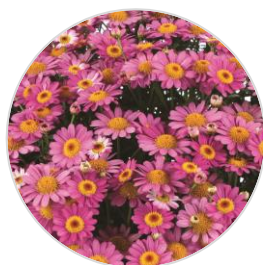
LOLLIES™ Pink Pez