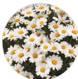
LOLLIES™ White Chocolate