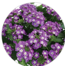
VANESSA™ COMPACT Optik Lavender