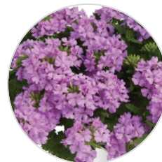
VANESSA™ COMPACT Bordeaux