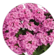
VANESSA™ COMPACT Pink