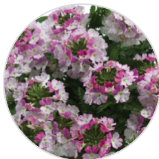
VANESSA™ COMPACT Bicolor Rose