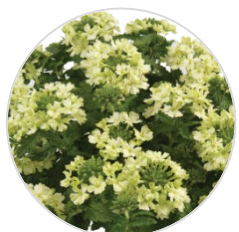
VANESSA™ COMPACT Lime