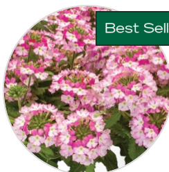
VANESSA™ Bicolor Pink