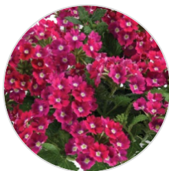
VANESSA™ Dark Pink