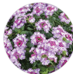
VANESSA™ Bicolor Purple