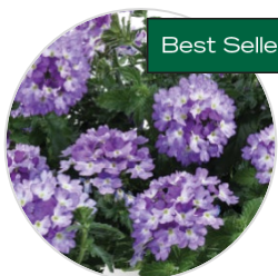
VANESSA™ Bicolor Indigo