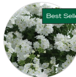
VANESSA™ Blanc amélioré