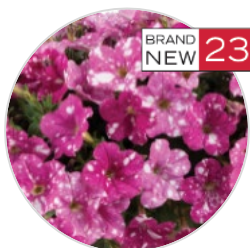
SPLASH DANCE™ Rumba Rose