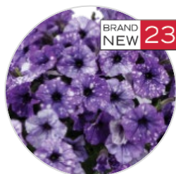
SPLASH DANCE™ Moon Walk