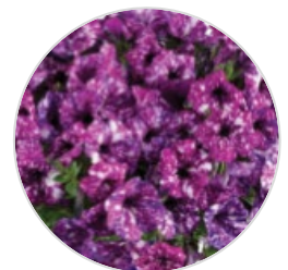
SPLASH DANCE™ Петуния гибридная

Для получения дополнительной технической информации о выращивании: