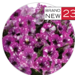
SPLASH DANCE™ Fuchsia Flamenco