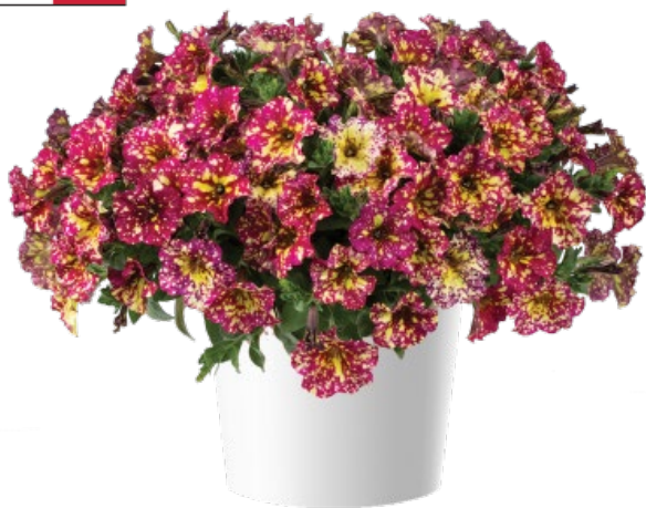
Сорт SPLASH DANCE™ Calypso Cherry