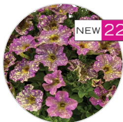
SPLASH DANCE™ Poppin' Pink