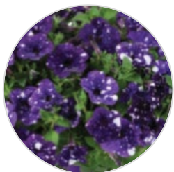
SPLASH DANCE™ Calypso Cherry