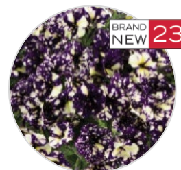
SPLASH DANCE™ Violet Vogue