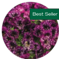
SPLASH DANCE™ Петуния гибридная