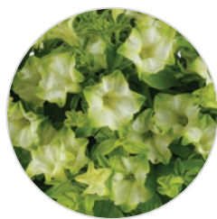
Pistachio Cream RAY™