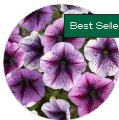
Purple Vein RAY™