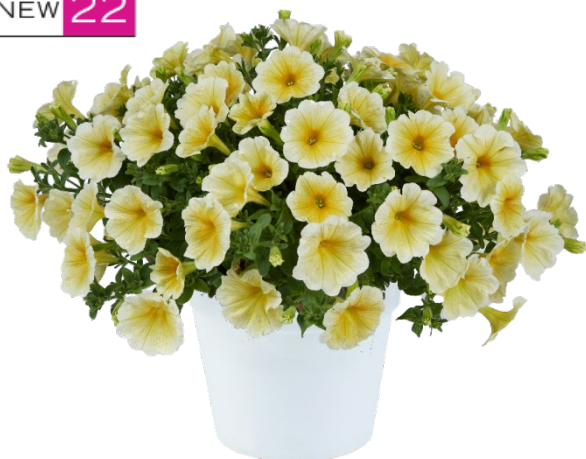
Сорт Sunshine Improved RAY™