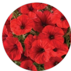
Red improved RAY™