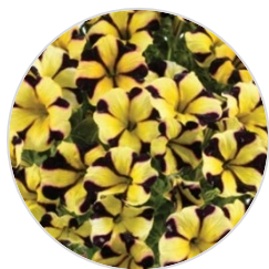
Sunflower Imp. RAY™