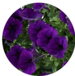
Blue Imp. RAY™