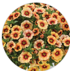
EYECONIC™ Compact Sunset