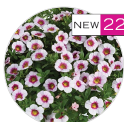
EYECONIC™ Cherry Blossom